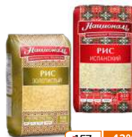
Рис «Националь» Испанский, Бальдо, Краснодарский, Золотистый 800-900г