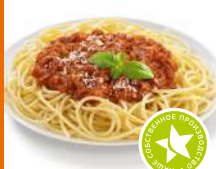
Паста Болоньезе 250г