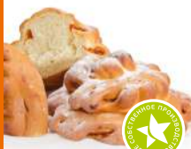
Булочка Хризантема с корицей 100г/шт