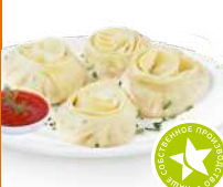
Манты Южные отварные 1кг