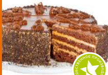
Торт «Славянка» 1100г