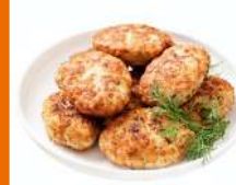
Котлеты по-селянски куриные жареные 1кг