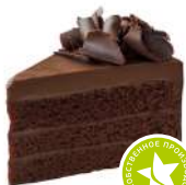
Торт «Маргарита» 1100г