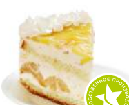
Торт «Колибри» 1000г