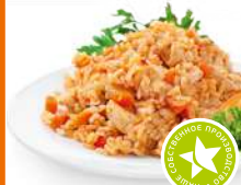
Плов с курицей 1кг