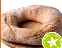
Чиабатта с рожью 1кг