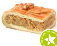
Пирог дрожжевой с капустой 1кг