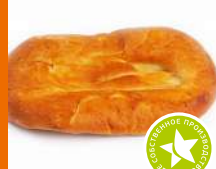
Лаваш с кукурузой 250г/шт