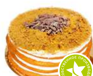
Торт «Сметанник» по-домашнему 500г