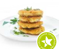
Драники картофельные жареные 1кг