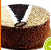
Торт «Три аккорда» 1300г