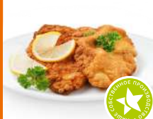
Шницель по-министерски жареный 1 кг