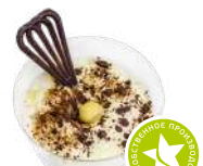
Десерт «Белоснежка» 1кг