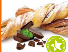
Слойка французская с шоколадом 120г