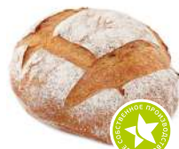
Хлеб Рустик 350г/шт