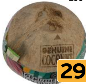
Кокос молочный 1шт