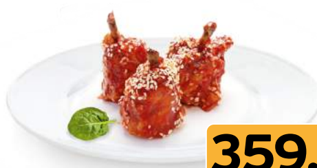
Крылья куриные Нон-жа запеченные 1 кг