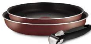
Сковорода «Тефаль» Кук райт 24см