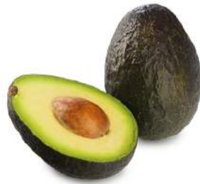
Авокадо Хасс 2 шт/1уп