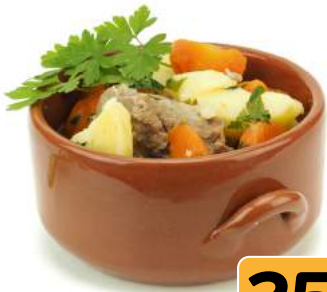
Жаркое из свинины запеченное в горшочке 1 кг