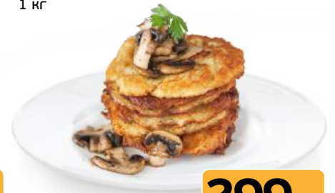
Драники с грибами 1 кг