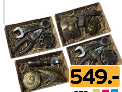
Конфеты «Бабаевские» «С 23 февраля» 200г