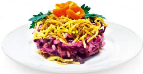
Салат «Миланский» 1 кг