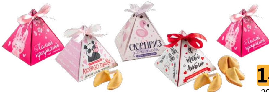
Печенье с предсказаниями на день Валентина в ассортименте