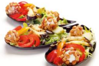
Салат легкий с сырными шариками 1 кг