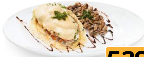
Свинина запеченная с грибами 1 кг