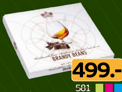
Конфеты «Варнер Хадсон» с бренди 500г