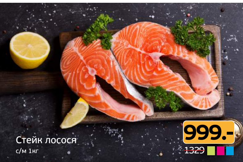
Стейк лосося с/м 1кг