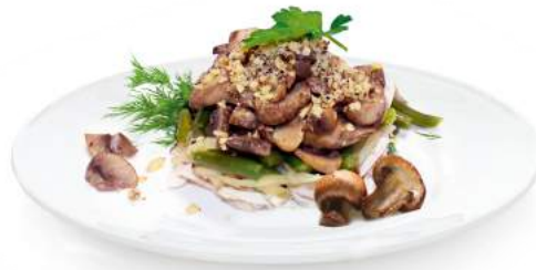
Салат с курицей и зеленой фасолью 1 кг