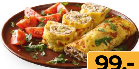
Рулетики картофельные с мясом 330г/1шт