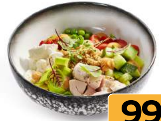
Поке с курочкой копченой 250/50г/1шт