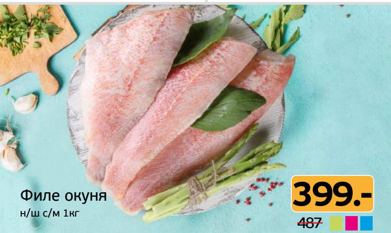
Филе окуня н/ш с/м 1кг