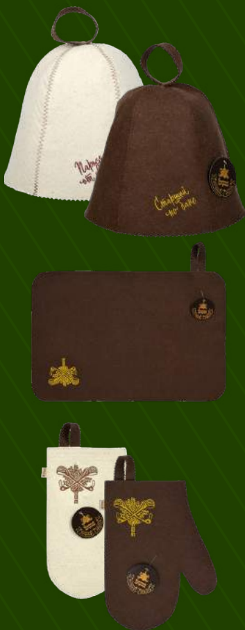
Банные аксессуары «Банные штучки» в ассортименте