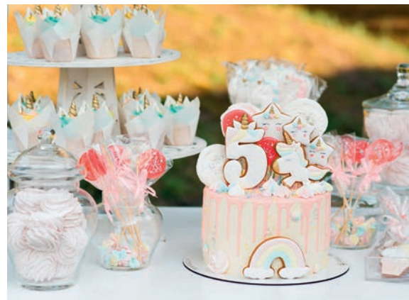
➤ ДЕТСКИЙ ДЕНЬ РОЖДЕНИЯ