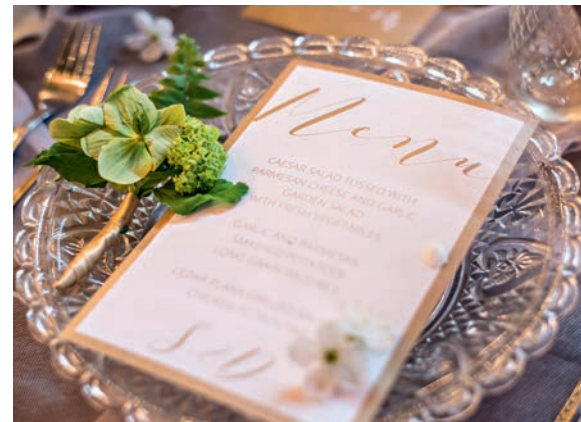
➤ СВАДЕБНОЕ ТОРЖЕСТВО